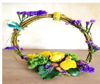
Atelier art floral. Réalisation de Lucette